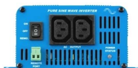
Phoenix omvormer 12/350 met IEC-320 stopcontact