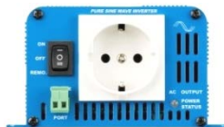
Phoenix omvormer 12/180 met Schuko stopcontact