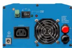
Phoenix omvormer 12/800 met IEC-320 stopcontact