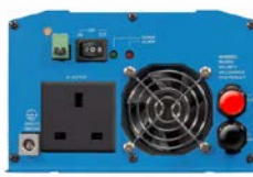
Phoenix omvormer 12/800 met BS 1363 stopcontact