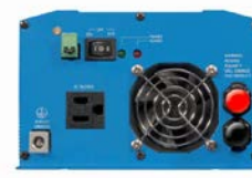
Phoenix omvormer 12/800 met Nema 5-15R stopcontact