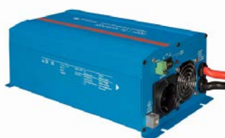
Phoenix omvormer 12/800 met Schuko stopcontact