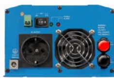
Phoenix omvormer 12/800 met Schuko stopcontact