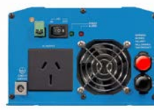
Phoenix omvormer 12/800 met AN/NZS 3112 stopcontact