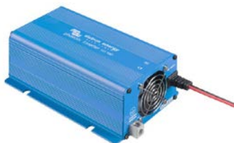
Phoenix omvormer 12/180