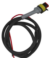
Besturingskabel voor Cyrix-ct 12/24-230 Lengte: 1 m