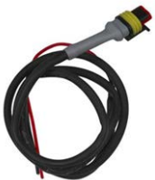
Besturingskabel voor Cyrix-ct 12/24-230 Lengte: 1 m